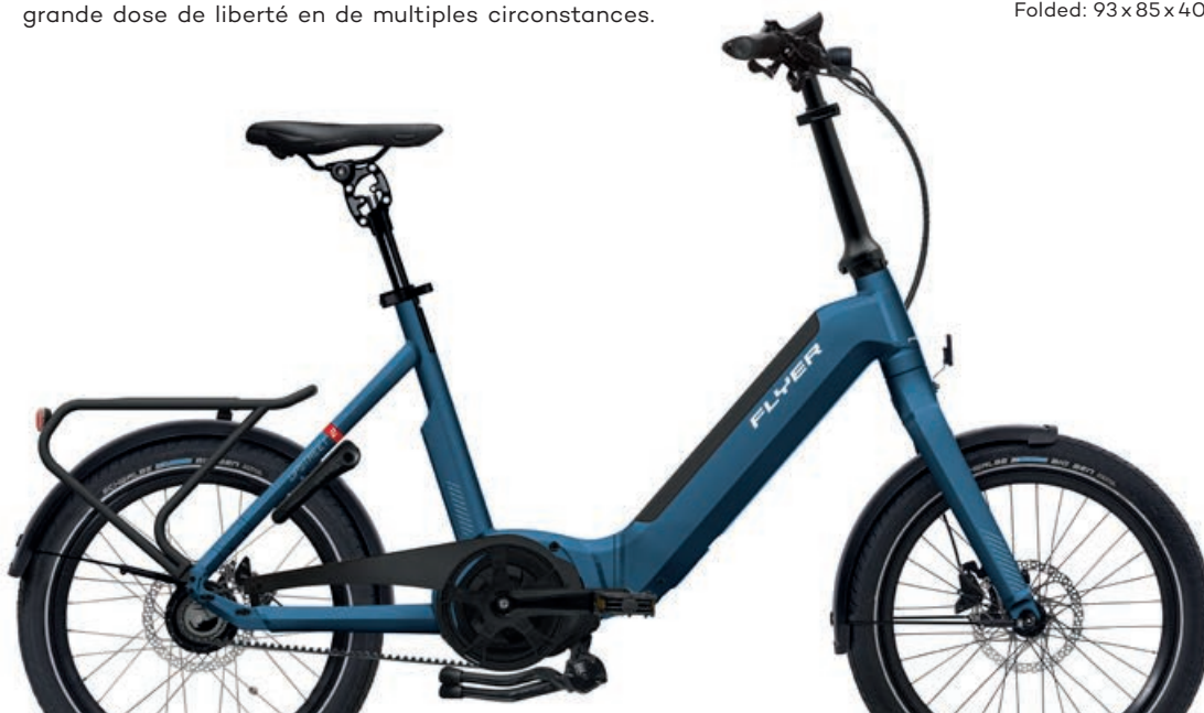
Upstreet2 7.43 Jeans Blue

L'équipement des modèles FLYER représentés peut être différent des spécifications. Les couleurs peuvent être différentes.